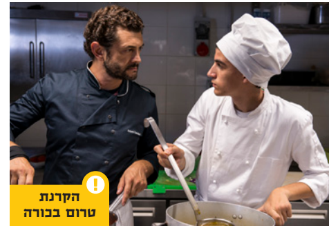
הקרנת טרום בכורה