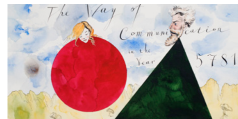
פבל פפרשטיין, אופן התקשורת בשנת 5781, 2017, מוזיאון ישראל, ירושלים © Pavel Pepperstein, Photo courtesy of Nahodka Arts, London, by Nataliya Tazbash

שיחה: הניצחון על המוח , פרופ' שאול הוכשטיין, האוניברסיטה העברית, טניה סידקוביץ', מוזיאון ישראל לרגל התערוכה: הניצחון על השמש