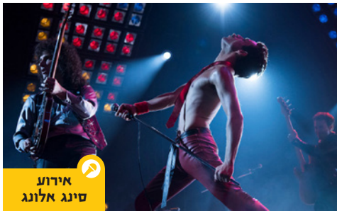
אירוע סינג אלונג

סרט: רפסודיה בזהמית , 2018 גרסת "סינג אלונג"